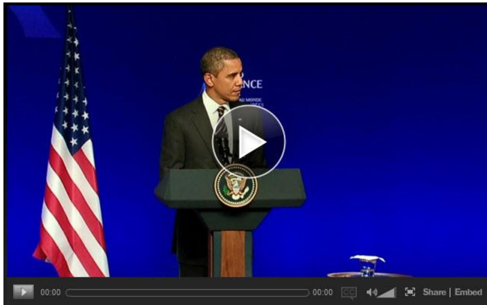
The White House – President Obama's Press Conference on the G20 Summit

El pasado 4 de noviembre, en el cierre de la cumbre del G20 celebrada en Cannes, Obama aseguró que se han conseguido avances importantes para afrontar la crisis. Pero, al mismo tiempo, reconoció que la situación económica todavía es frágil y que aún hay mucho trabajo por delante. Leer más