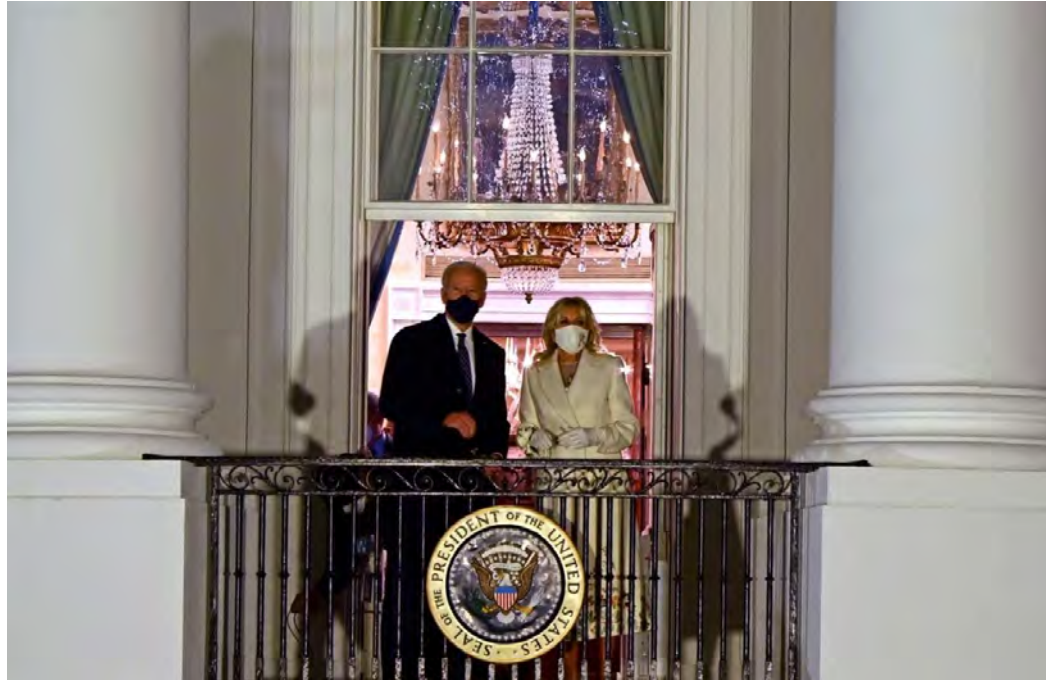
El Presidente de los Estados Unidos Joe Biden y la Primera Dama Jill Biden, en el Balcón del Salón Azul la Casa Blanca en Washington, DC el 20 de enero de 2021.

Joe Biden asume la presidencia de los Estados Unidos de América en un acto de inauguración como ningún otro; Trump no se presenta a la ceremonia