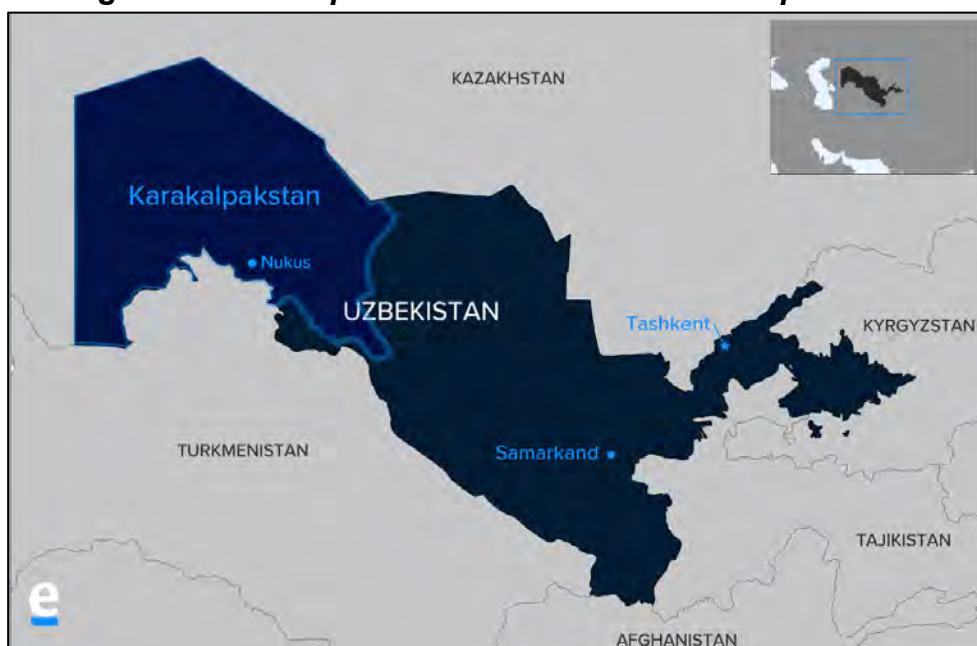
Figura N° 4 – “República Autónoma de Karakalpakistán”