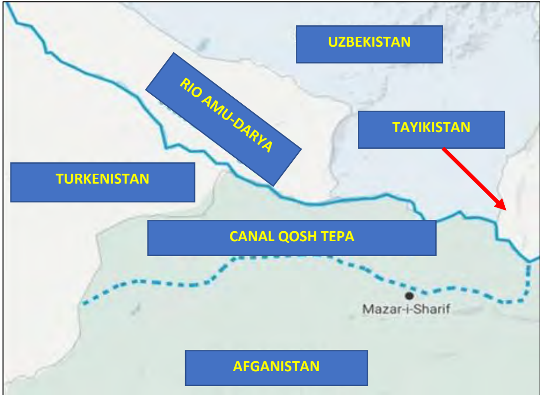
Figura N° 3 – Canal Qosh Tepa (Afganistán)