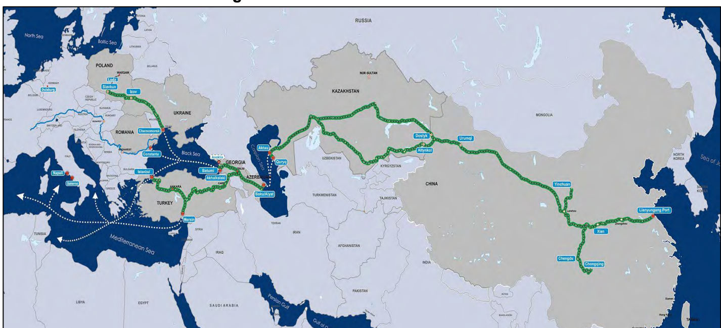
Figura N° 1 - “Corredor Medio”